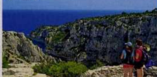
En-Vau offre aux bons marcheurs ses falaises déchiquetées.

Quel que soit le moyen pour découvrir les calanques, l'air marin mêlé au parfum des pins, l'éclat du soleil sur la roche et le dégradé de bleu de la mer composent le cadre de la balade. À respecter pour que ce littoral reste sauvage.